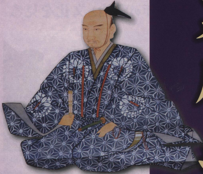
第6代 長谷川忠国代官 飛騨の税制改革や 山林調査などを行なった。